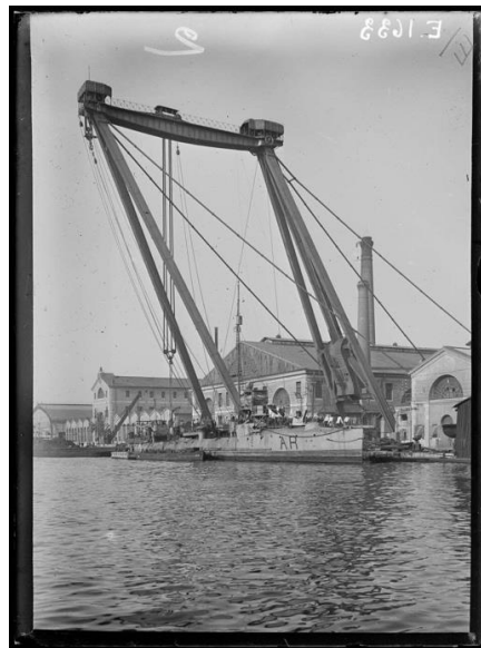
Figure 1 : Le contre-torpilleur Arc faisant enlever ses chaudières pour être réparées, à Toulon 16 août 1916.

Une entente est nécessaire entre les marines alliées pour le ravitaillement et les réparations. D'une part parce que les denrées de première nécessité tout comme les industries d'armement sont protégées en temps de guerre par des lois et des règlements, d'autre part parce que les réparations sont faites loin des ports de base des navires. Des Services centralisateurs sont mis en place en France dès le début de la guerre pour les matières premières comme le charbon industriel, les aciers ou le bois. Ils doivent faciliter la prise des commandes et le fait que ces dernières soient assurées. Il faut par ailleurs obtenir l'accord des alliés dès que l'on sort du territoire national. C'est notamment le problème rencontré en Adriatique par la flotte française puisque le gouvernement italien empêche toute sortie du bois, des céréales et du charbon de son territoire 1 . Il faut passer des contrats, que ceux-ci soient validés par le gouvernement ou son représentant, les denrées obtenant alors un laissez-passer.